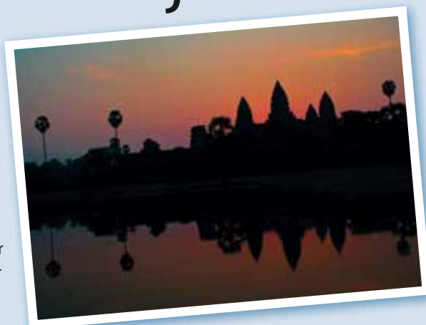
Morgenstemning: Soloppgangen ved tempelkomplekset Angkor Wat i Kambodsja har noe majestetisk og guddommelig over seg.

Etter sterke inntrykk i Phnom Penh gikk turen videre til byen Siem Reap, hvor hovedattraksjonen var tempelruinene Angkor Wat. Tidlig, tidlig og enda tidligere enn det stod vi