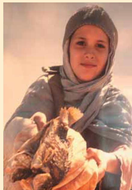
Bilder: Marit Mælum Nordal