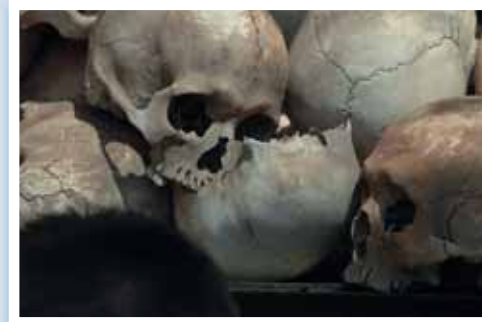
Hoderystende: En kambodsjaner ser på noen av sine medborgeres hodeskaller ved Killing Fields som ble tatt av dage av Pol Pot på midten av 70-tallet.